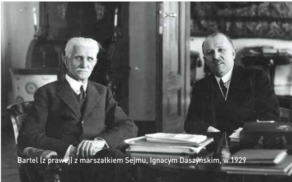
Bartel (z prawej) z marszałkiem Sejmu, Ignacym Daszyńskim, w 1929