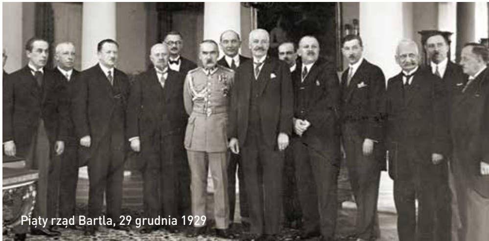
Pięty rząd Bartla, 29 grudnia 1929

z kadencją Sejmu i trwała 5 lat. W Polsce odrodzonej Senat funkcjonował przez 5 kadencji. Pierwsze posiedzenie Senatu w II Rzeczypospolitej odbyło się 28 listopada 1922 r.