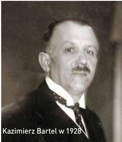
Kazimierz Bartel w 1928