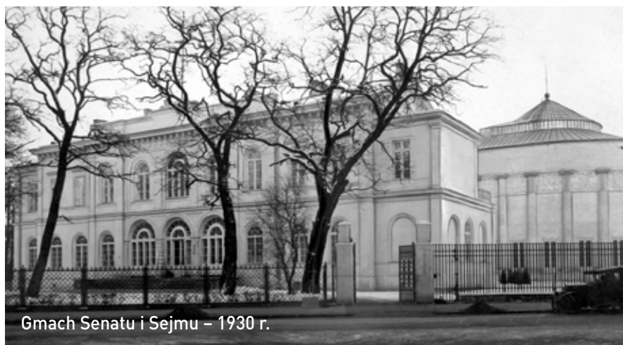
Gmach Senatu i Sejmu – 1930 r.

W Warszawie zobaczyliśmy pomnik Józefa Piłsudskiego, przy bocznym wejściu do Belwederu, przy placyku, z którego jest jedno z wejść do Łazienek Królewskich. Monument długo czekał na swoje odświeżenie w 1998 roku. Stanisław Ostrowski wykonał marmurowy pomnik Marszałka jeszcze przed II wojną światową. Przechowany w Starej Pomarańczarni w Łazienkach Królewskich, stał się podstawą do wykonania odlewu. Rzeźba została odlana ze spiżu, dzięki inicjatywie Ministerstwa Obrony Naro-