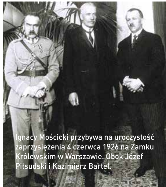
Ignacy Mościcki przybywa na uroczystość zaprzysiężenia 4 czerwca 1926 na Zamku Królewskim w Warszawie. Obok Józef Piłsudski i Kazimierz Bartel.